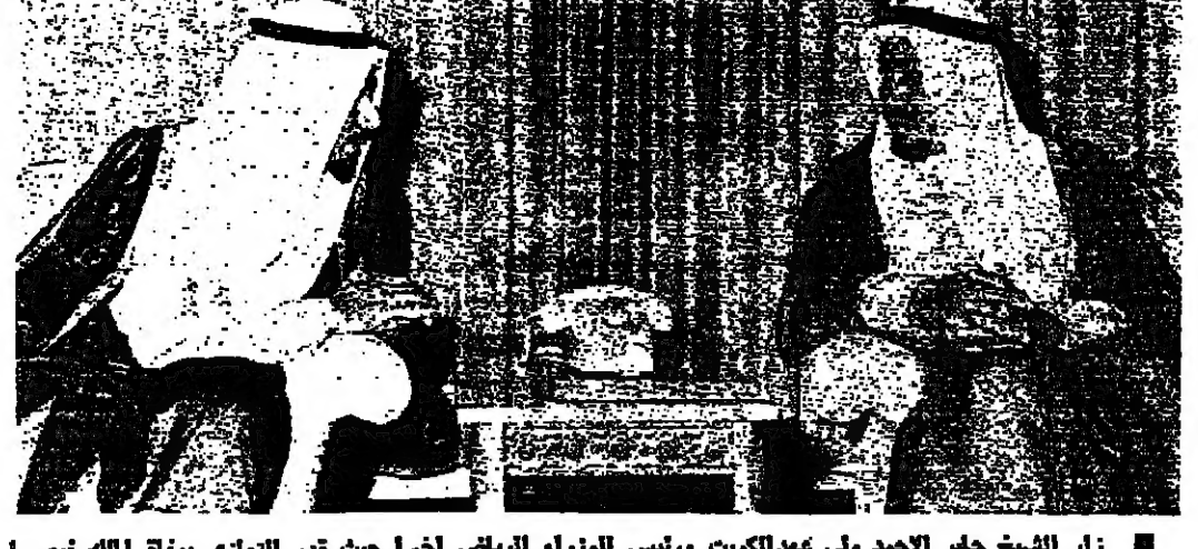
زار الشيخ جابر الاحمد ولي عهد الكويت ورئيس للوزراء الكويتي امراً حيث قدم التعازي بوفاء الملك فيصل الى الملك خالد والمسؤولين السعوديين. وفي الصورة يندو الملك خالد والشيخ جابر